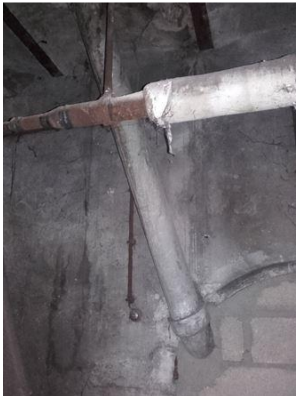
Cave (Sous-sol) - Conduit - Fibre ciment