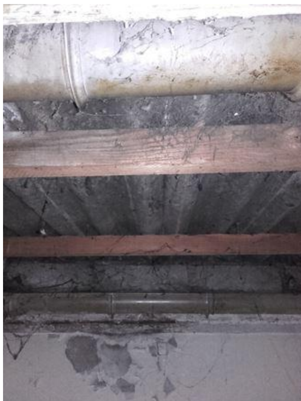
Réserve (Rdc) - Toiture - Couverture